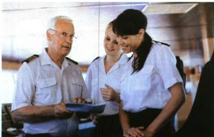
Η πλειονότητα των γυναικών ναυτικών στην Ελλάδα απασχολείται στην ακτοπλοία και κυρίως συνδέεται με τον θαλάσσιο τουρισμό.

Η ΣΥΝΕΡΓΑΣΙΑ μας με την ακαδημαϊκή κοινότητα, αρχικά της ομοίας είναι η υπογραφή Μνημονίου Συνεργασίας με το Πανεπιστήμιο Δυτικής Αττικής (ΠΑΔΑ) και το Ερευνητικό Εργαστήριο Κοινωνικής Διοίκησης (ΕΕΚΔ) του ΠΑΔΑ που υπογράψαμε