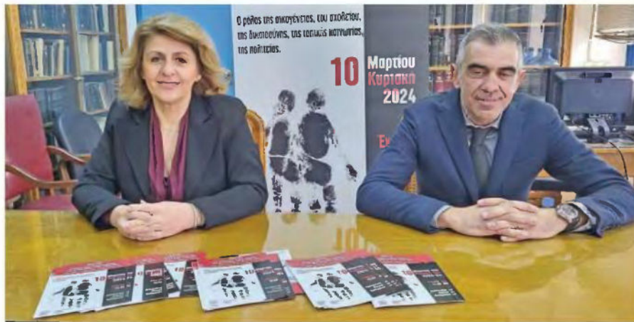
Ρεπορτάζ Νικόλεττα Κουλιούρη

Μεγάλο προβληματισμό και ανησυχία, όπως και την ανάγκη για άμεσες λύσεις, προκαλούν τα όλο και αυξανόμενα περιστατικά βίας και παραβατικότητας των ανηλίκων. Φαινόμενα που ναι μεν καταγράφονταν και παλιότερα, αλλά τώρα παρουσιάζουν μια σημαντική ποιοτική διαφοροποίηση.