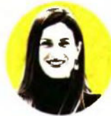
ΑΡΘΡΟ ΤΗΣ ΡΕΓΙΝΑΣ ΦΡΕΝΤΖΟΥ, ΔΙΕΥΘΥΝΤΡΙΑΣ ΤΗΣ DAAD ΕΛΛΑΔΟΣ