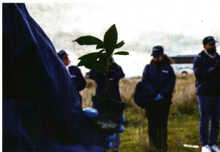
Πάνω: Ανάμεσα στις πολλές δράσεις περιβαλλοντικής ευαισθητοποίησης της εταιρίας, οι εργαζόμενοι της ΕΥΔΑΠ συμμετείχαν σε εθελοντική δένδροφύτευση, σε συνεργασία με τη We4All. Κάτω: Τοιοκογραφία του καλλιτέχνη STMTS, στο πλαίσιο της συμμετοχής της ΕΥΔΑΠ στην πρωτοβουλία «Γενιά 17» συντονίζοντας το όραμά της με αυτό του Στόχου 6 των Ηνωμένων Εθνών που αφορά στο Καθαρό Νερό και Αποκείμευση