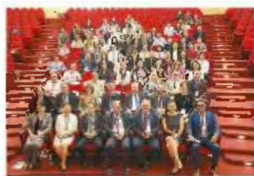
● Study in Greece: Εκπρόσωποι από 24 πανεπιστήμια της Κίνας βρίσκονται στην Ελλάδα για να διερευνήσουν συνεργασίες με ελληνικά ΑΕΙ. Σελ. 8