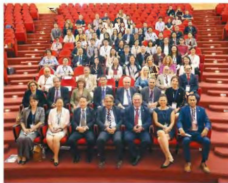
Η κινεζική εκδήλωση στο συνεδριακό κέντρο του Πανεπιστημίου Δυτικής Αττικής ήταν ένα σημαντικό βήμα της προσπάθειας που εγκαινιάστηκε από το ελληνικό υπουργείο Παιδείας σε συνεργασία με τον εθνικό φορέα εκπαιδευτικής διεθνοποίησης της Κίνας και τον αντίστοιχο ελληνικό φορέα Study in Greece.

«Ο γεωργικός τομέας είναι σημαντικό πεδίο συνεργασίας των